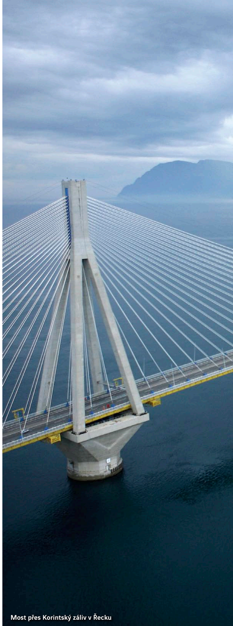
Most přes Korintský záliv v Řecku

EUROVIA je jedním z hlavních světových hráčů, který nabízí expertizu a know-how v oblasti dopravních infrastruktur (silnice, železnice...) a v územních plánech města, provozování lomů, průmyslové výrobě (továrny na pojiva, obalovny...) a službách.